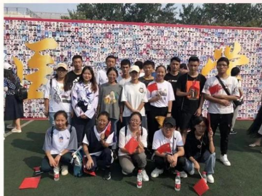
图为在北京大学首钢医院实习的17名西藏大学医学院学生