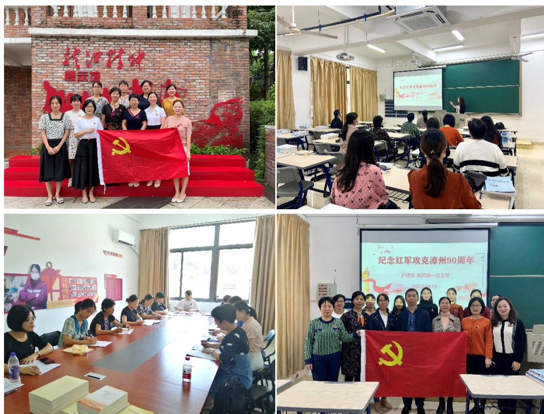
图2 党支部定期开展党的理论知识培训