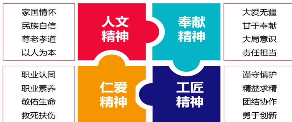
图 18 护理专业课程思政元素提炼