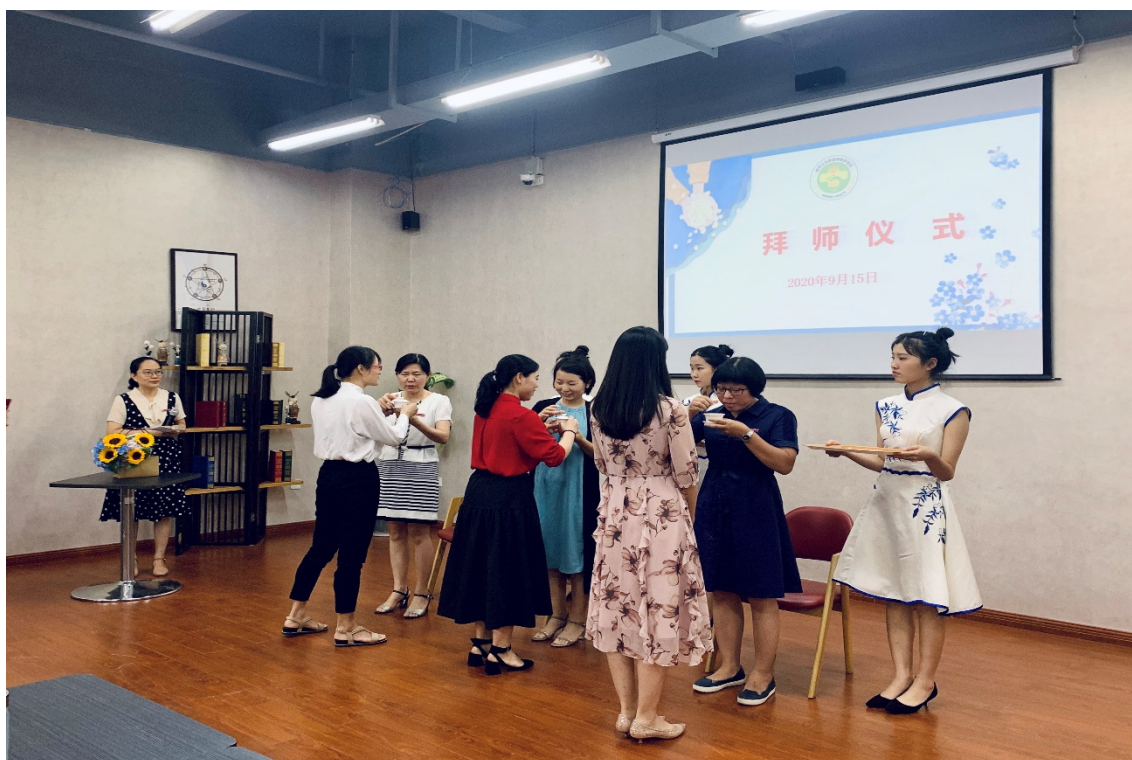
图 3 青年教师导师制“拜师仪式”