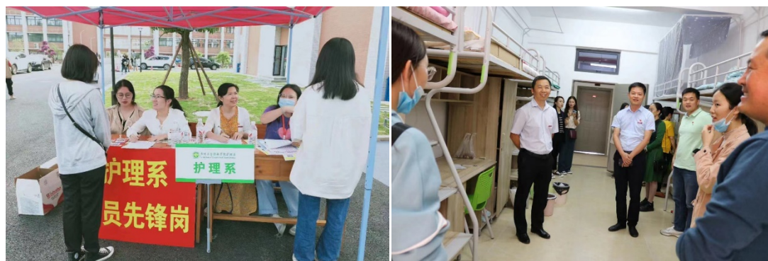
图 12 党支部教师带领青年志愿者迎接新生