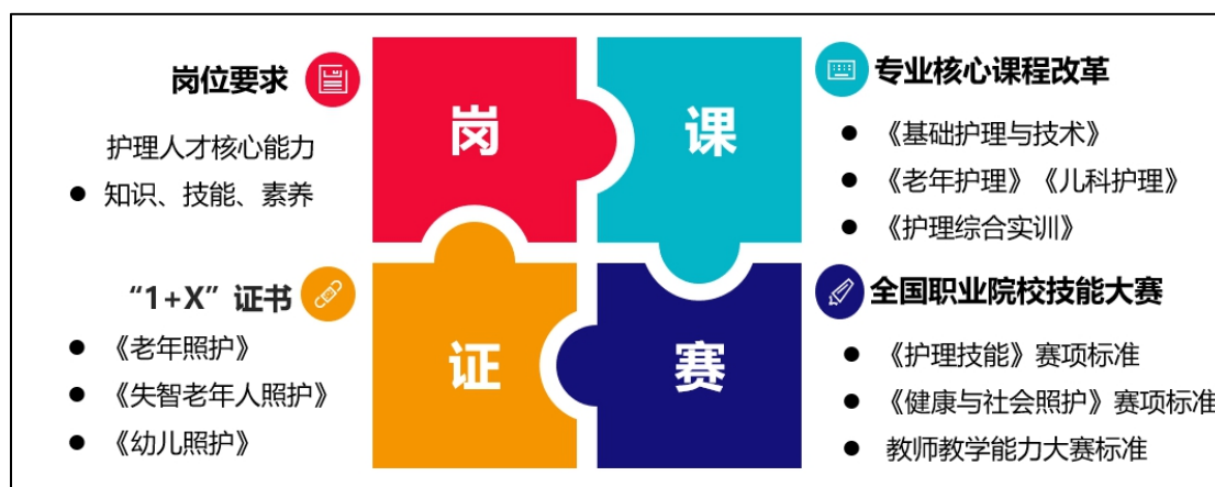
图 15 党支部引领“岗课赛证”融合创新