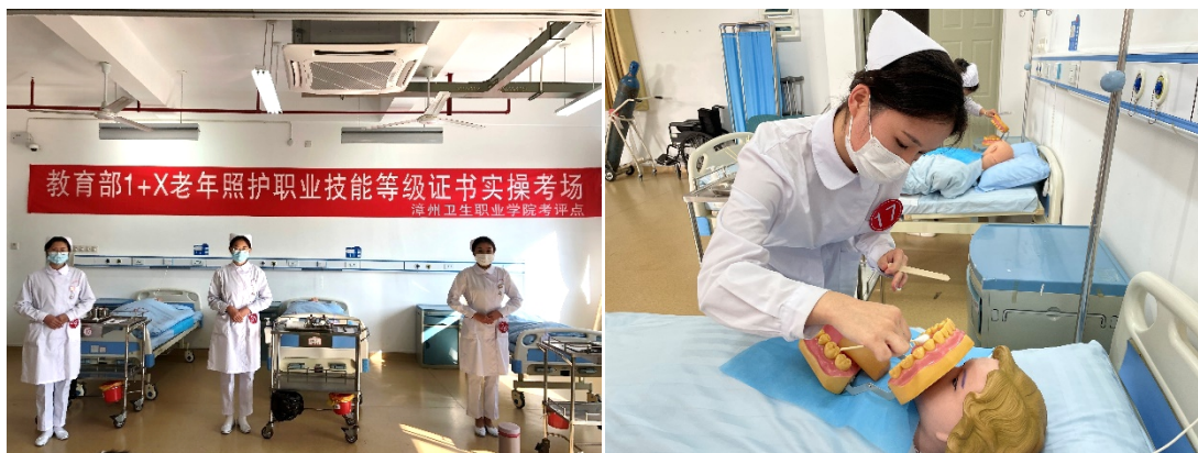
图 19 支部教学团队主持“1+X”职业技能等级证书培训考评工作