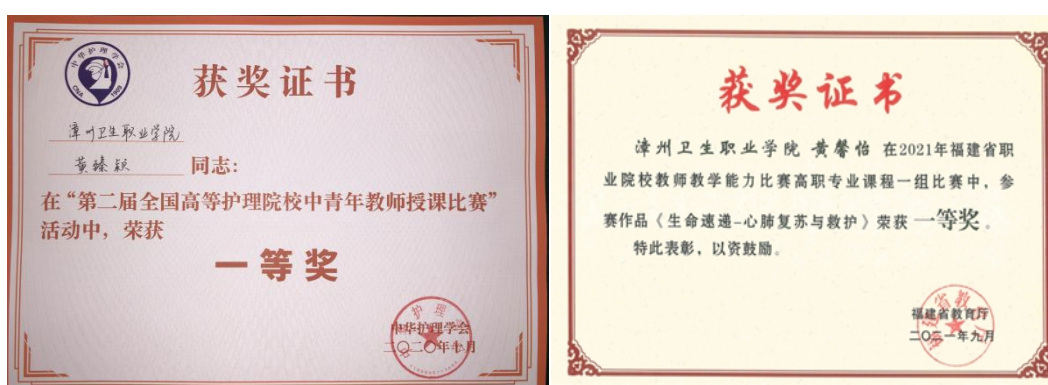
图 23 支部教师在参加国家级和省级教师教学能力比赛中获奖