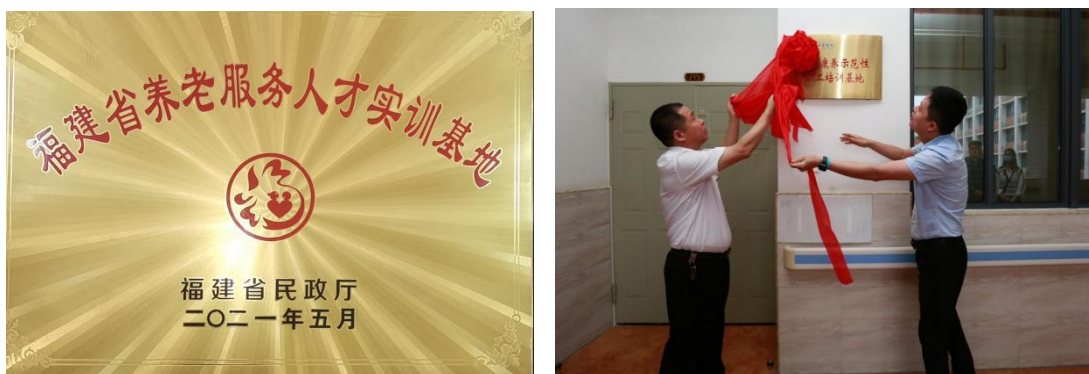
图 9 支部教师主持建设省级、院级实训基地