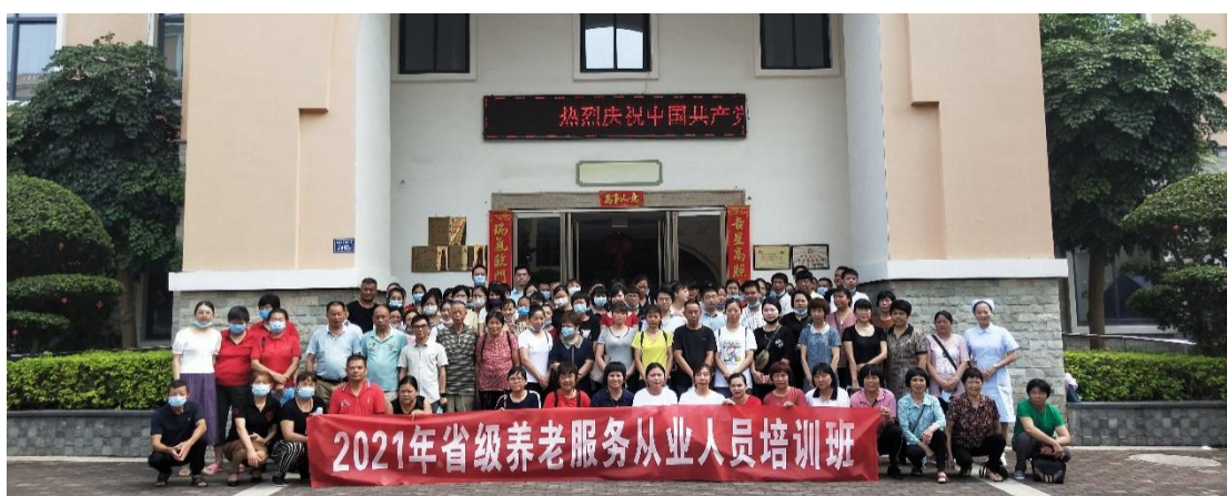
图 6 党支部教师协助承担省民政厅主办养老服务从业人员培训