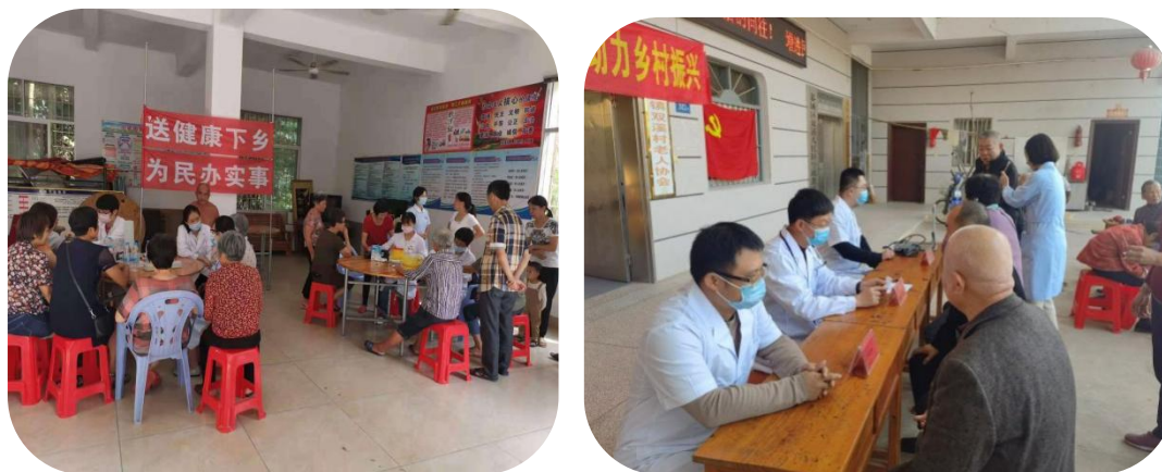
图 11 为村民提供免费义诊服务