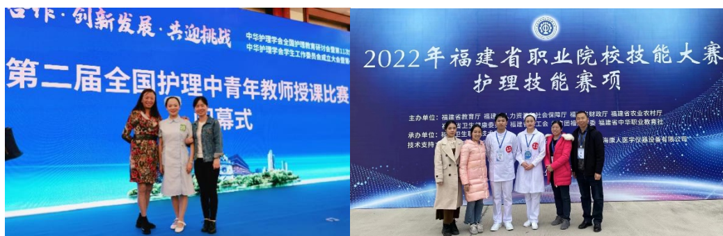
图 16 党支部多支项目团队积极参加国家级、省级技能竞赛