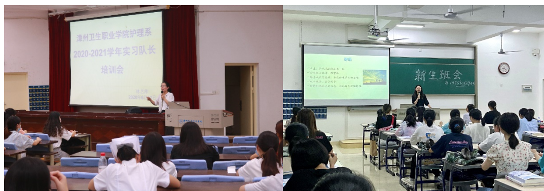
图 13 支部青年教师兼任班主任和实习总带教