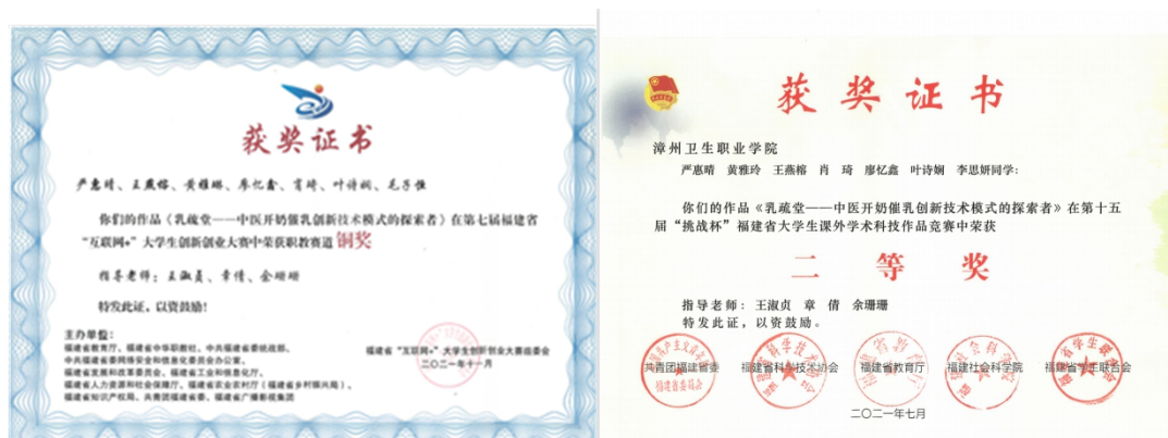
图 22 支部教师指导学生创新创业大赛、“挑战杯”获奖