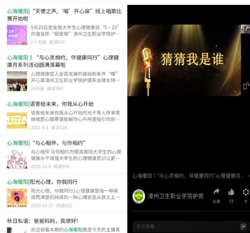
图 14 开设心海暖阳专栏及“唱”开心扉等活动