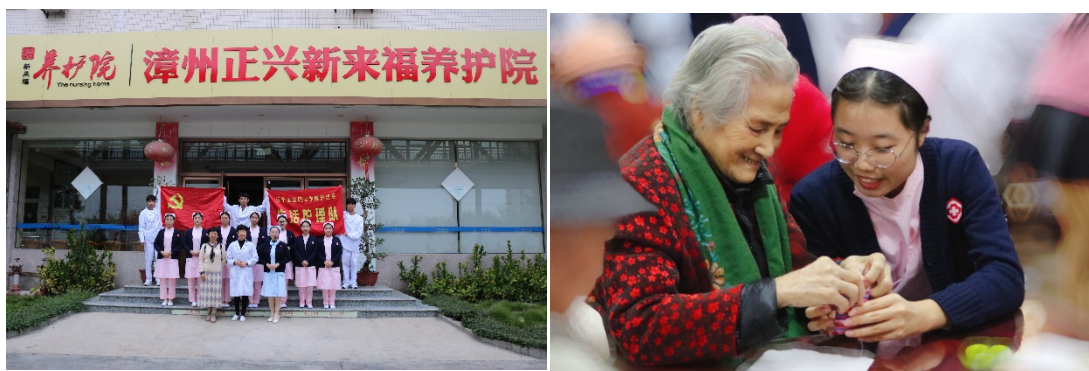
图 8 专业服务队在漳州正兴养护院开展“防流感香囊”敬老主题活动