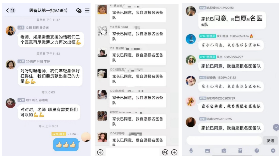
图 24 疫情期间护理系学子踊跃报名参加医疗预备队