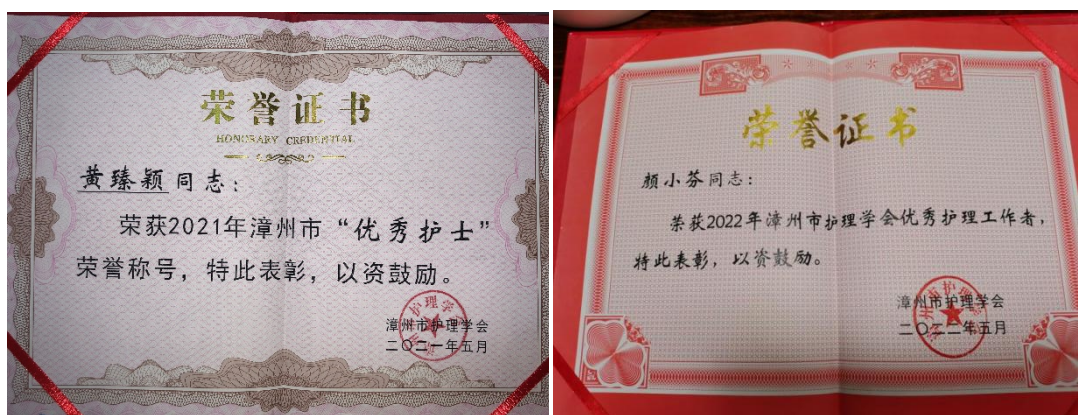
图 21 支部教师获漳州市优秀护士和优秀护理工作者称号