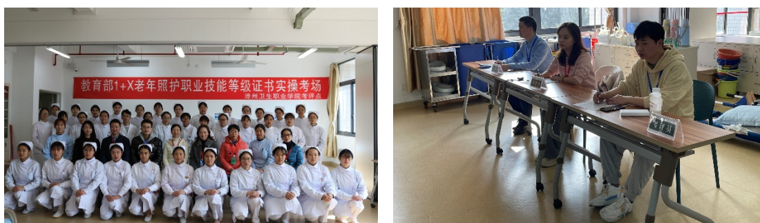
图 17 党支部教师主持参与 1+X 职业技能等级证书培训与考评工作