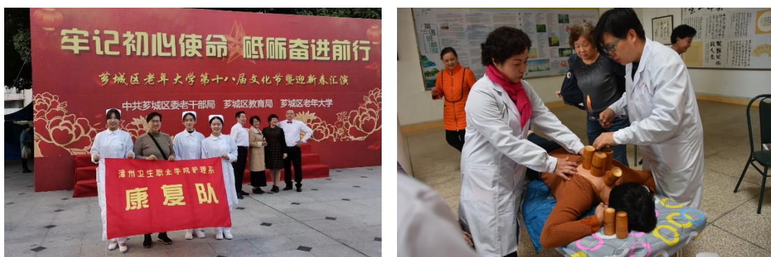
图 7 专业服务队在漳州市老年大学开展“中医针灸”义诊活动