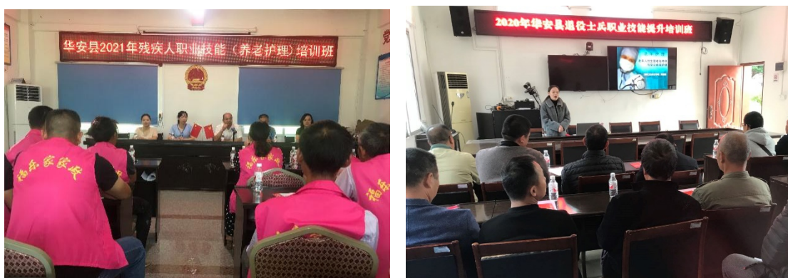
图 10 党支部教师为漳州各县残疾人、退役军人进行职业技能培训