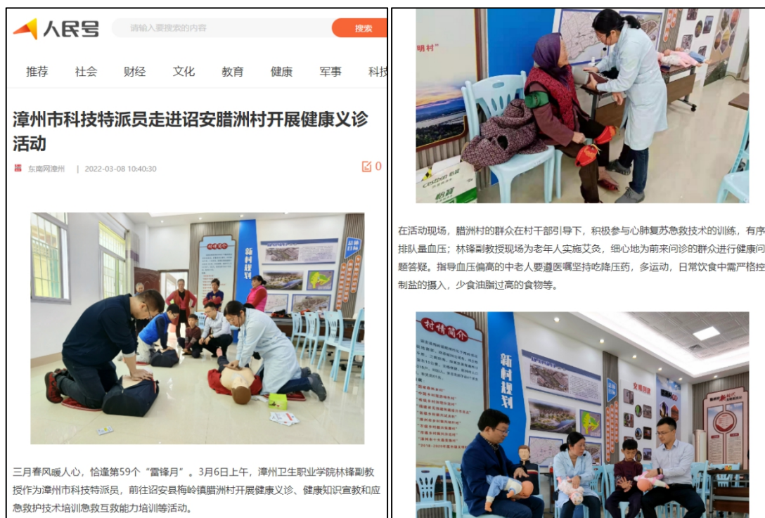
图 25 人民日报新媒体平台“人民号”报道党支部科技特派员工作